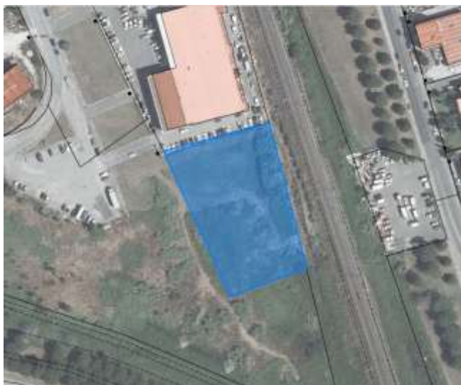
ESTRATTO CASTASTO – ORTOFOTO